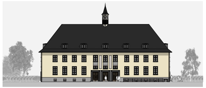
Für die Kita wird das südliche Bestandsgebäude umgebaut

Die neuen WABE-Kita nimmt mit ihrem Konzept der Pädagogik der Achtsamkeit Sprache, Musik und Bewegung in den Fokus. Durch die Angebote, Kurse und Projekte wird die Persönlichkeit jedes Kindes individuell gefördert und gestärkt. Jedes Kind kann sich in seinem eigenen Tempo entwickeln. Mit Funktionsräumen und Lernwerkstätten bietet die WABE-Kita qua-