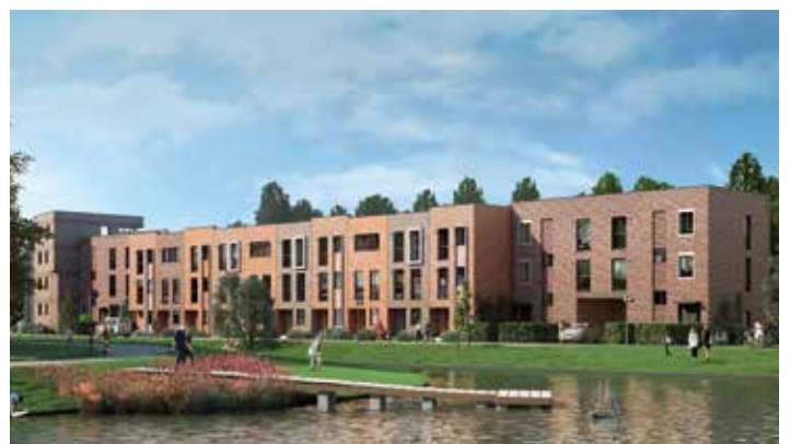
Mit JENNY SÜD entsteht ein weiteres Wohngebäude am Kuehnbachring