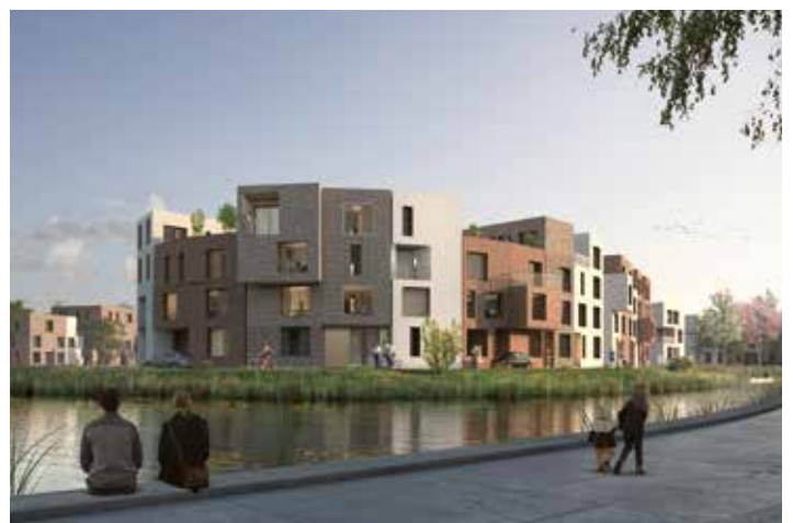
Jenfeld-Living direkt am Kuehnbachtümpel

Und auf dem nördlichen Teil des Baufeldes 16 wird die BEHRENDT Gruppe Stadthäuser und Mehrfamilienhäuser als Eigentum errichten.