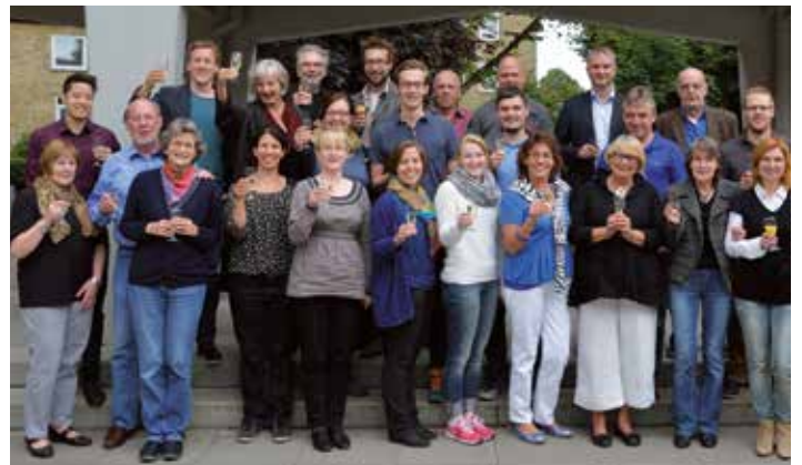
Baugemeinschaft Jenfelder Au: auf gute Nachbarschaft

Zwischen den beiden Immobilien laufen derzeit die Bauarbeiten auf dem Baufeld 3. Hier errichtet die cds Wohnbau Hamburg 18 Eigentumswohnungen mit einem bis vier Zimmern und Wohnflächen zwischen 37 und 159 m 2 sowie Stadthäuser mit vier bis fünf Zimmern und je rund 125 m 2 Wohnfläche.