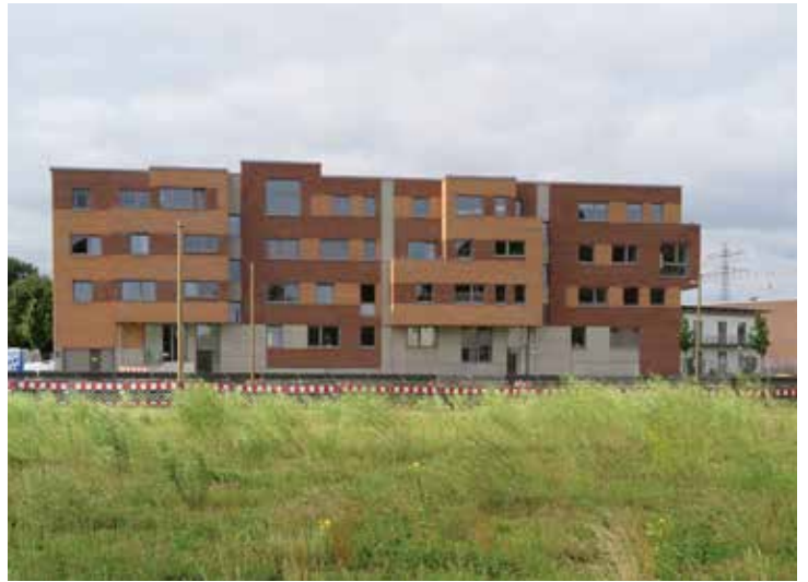
In der Jenfelder Au sind die Gebäude der BEHRENDT Gruppe (Bild links) und der Baugemeinschaft (Bild rechts) bezogen