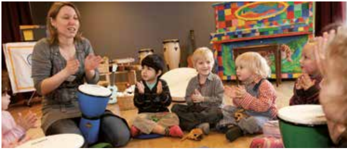
Musik ist ein Schwerpunkt im Kita-Konzept von WABE